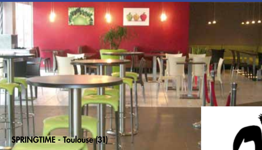
SPRINGTIME - Toulouse (31)