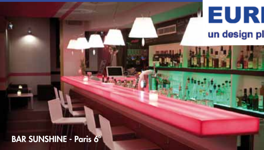
BAR SUNSHINE - Paris 6°