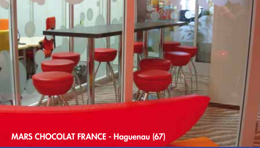
MARS CHOCOLAT FRANCE - Haguenau (67)