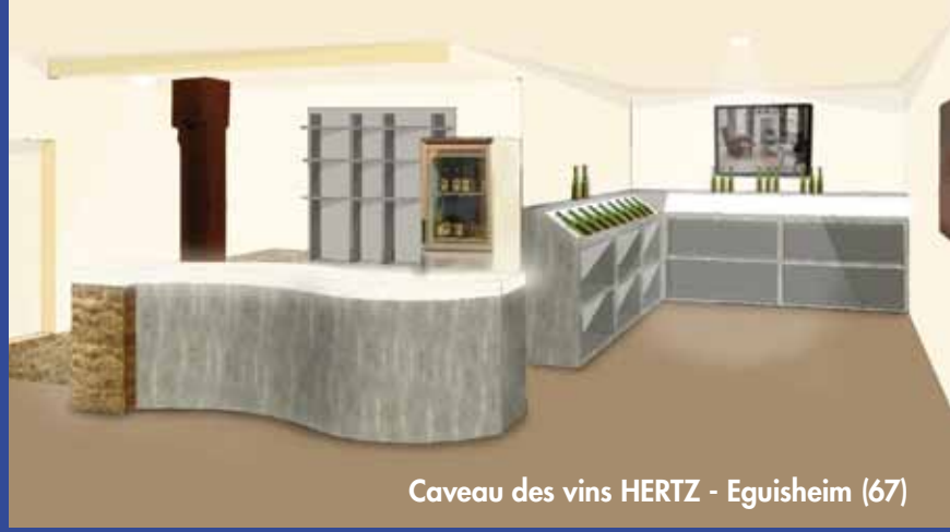
Caveau des vins HERTZ - Eguisheim (67)