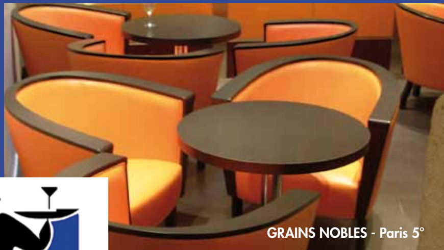
GRAINS NOBLES - Paris 5°

concepts & mobilier design pour le Professionnel