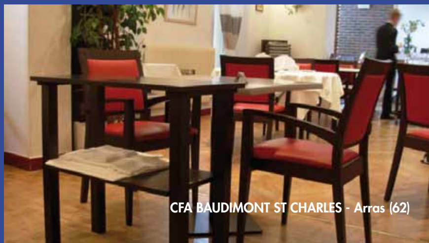
CFA BAUDIMONT ST CHARLES - Arras (62)