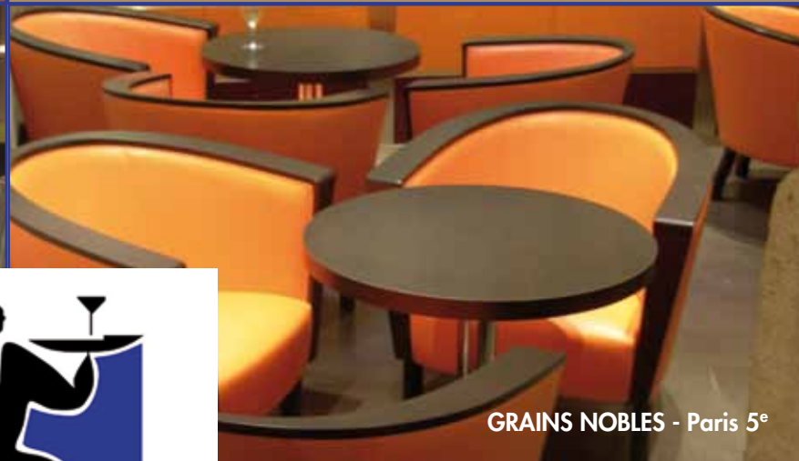
GRAINS NOBLES - Paris 5 e

concepts & mobilier design pour le contract