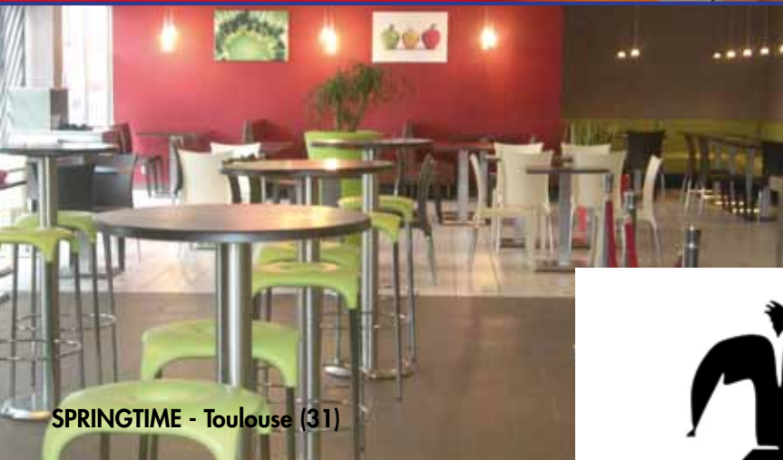
SPRINGTIME - Toulouse (31)