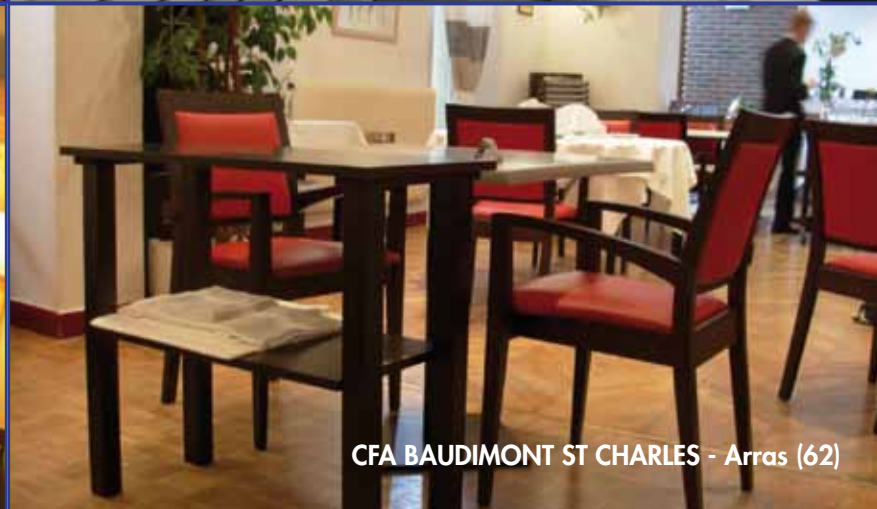
CFA BAUDIMONT ST CHARLES - Arras (62)