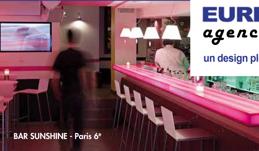
BAR SUNSHINE - Paris 6 e