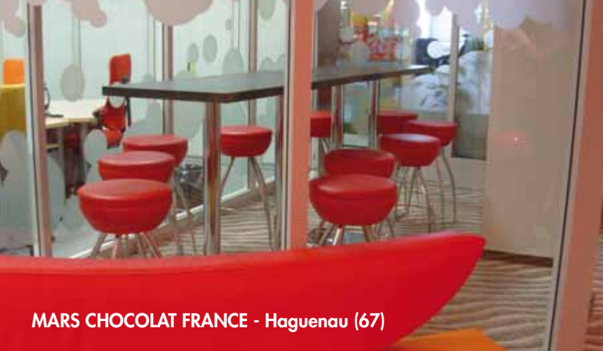
MARS CHOCOLAT FRANCE - Haguenau (67)