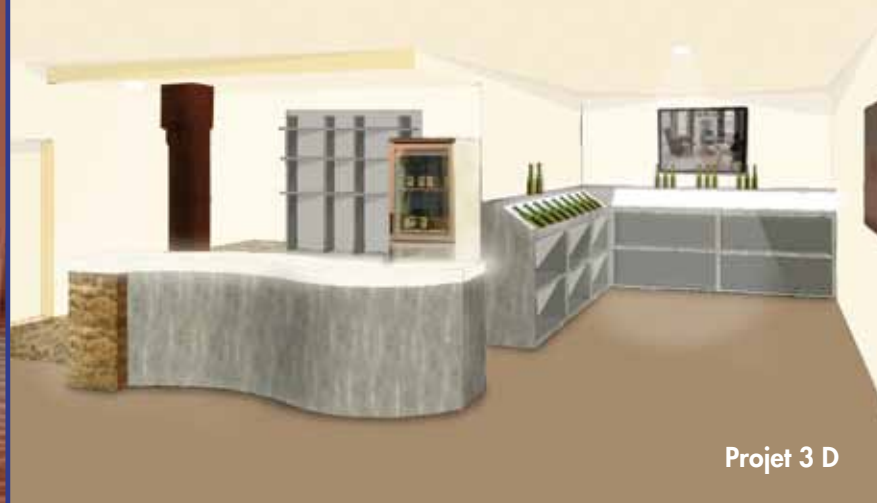
Projet 3 D