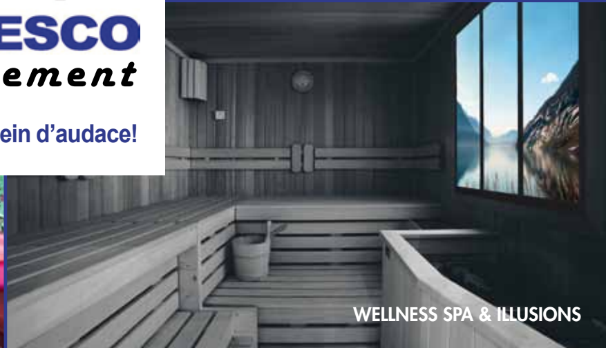
WELLNESS SPA & ILLUSIONS